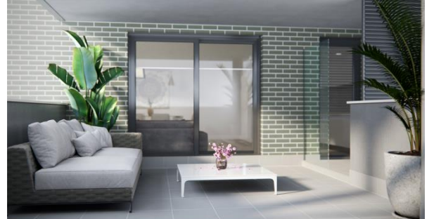
Esta infografía no es contractual en todos los elementos que no sean solados y/o alicatados.