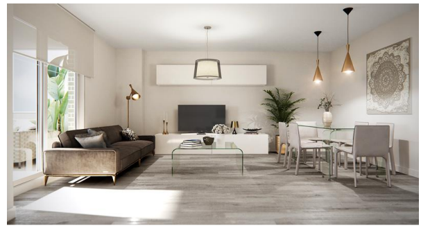
Esta infografía no es contractual en todos los elementos que no sean solados y/o alicatados.