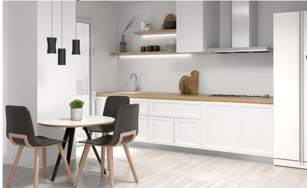
Esta infografía no es contractual en todos los elementos que no sean solados y/o alicatados.

Instalación de sistema Domótico mediante alarma con posibilidad de ampliación y detectores de inundación en cuartos húmedos de la vivienda