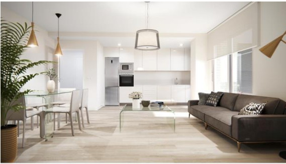
Esta infografía no es contractual en todos los elementos que no sean solados y/o alicatados.